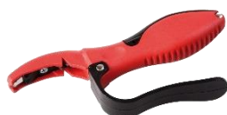
Afilador manual - Cód. 7285 EAN 8435128272855