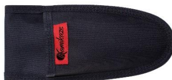
Funda - Cód. 6421 EAN 8435128264218