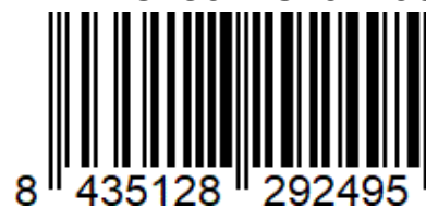
Foto del producto